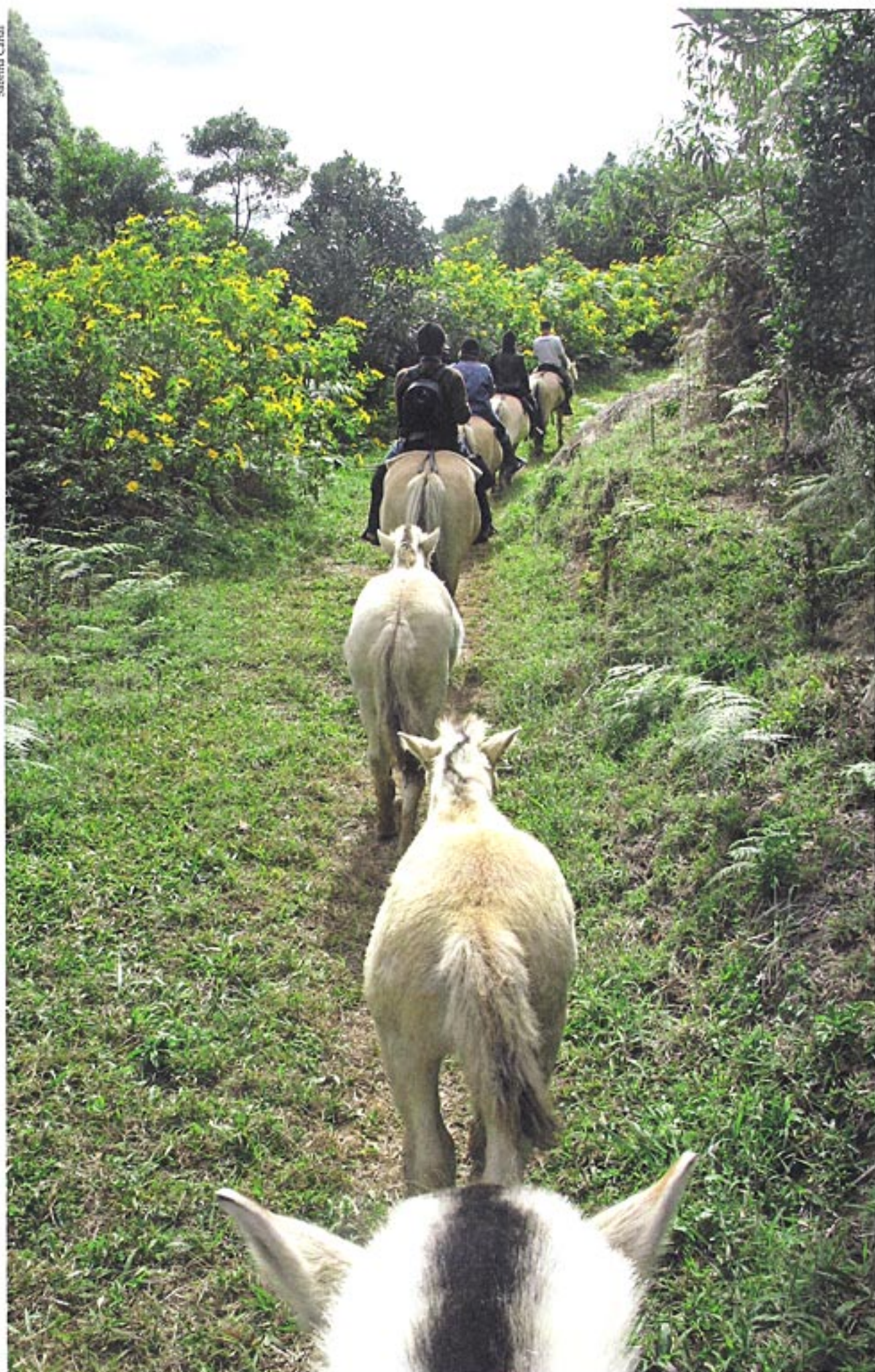
Durante o trajeto, os turistas percorrem trilhas no plantio de café orgânico da propriedade do empresário

Os investimentos devem ser ampliados com a abertura de novas trilhas, proporcionando aos visitantes conhecer outras belezas da região. A Trilha dos